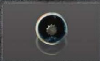
Eixo da transmissão 10mm x 11 estrias