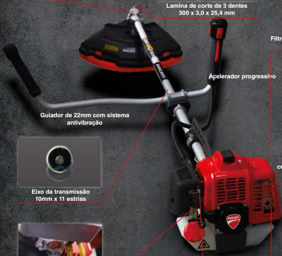
Guiador de 22mm com sistema antivibração