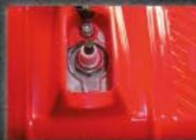
Vela NGK BPMR6A