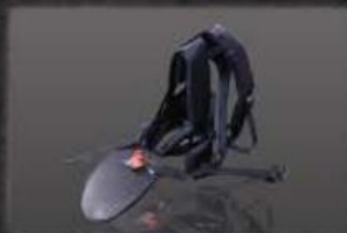
Arnês profissional duplo com reforço lombar