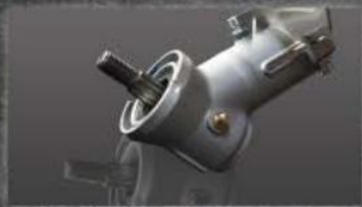
Cabeça da transmissão profissional com duplo rolamento e lubrificador