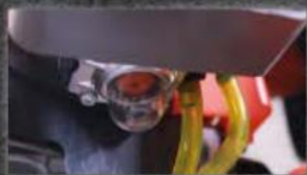
Bomba de apoio