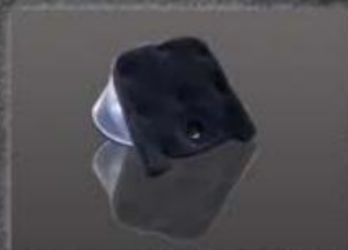
Filtro de ar em esponja fechada com abertura manual