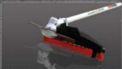
Lamina de corte de 3 dentes 300 x 3,0 x 25,4 mm